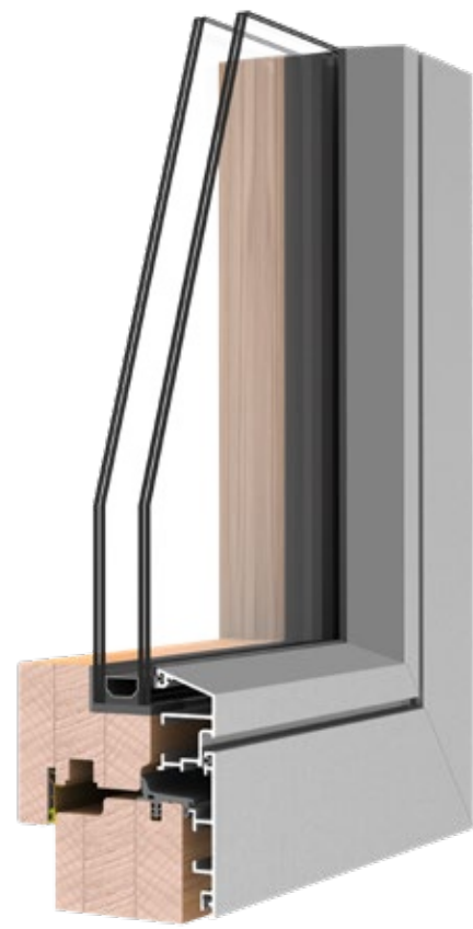
REQUADRO LINE U_w 1.2