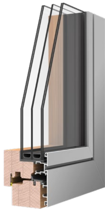
REQUADRO HPF U_w 0.8 ANTA ESTERNA COMPLANARE