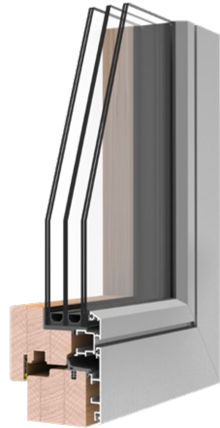
REQUADRO HPC U_w 0.8 CON TRIPLO VETRO